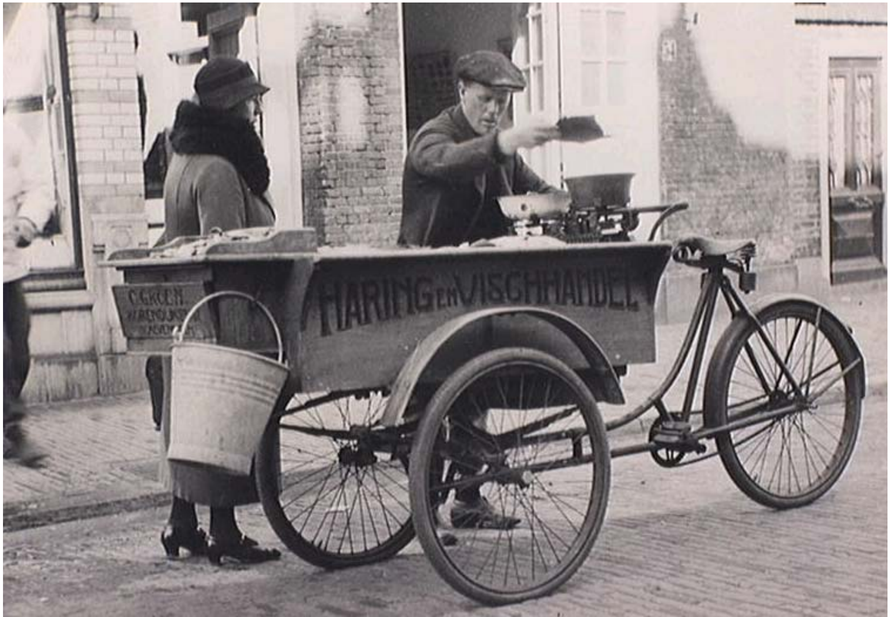
'Haring- en Vischhandel' van C. Groen op een onbekende plek, 1935

Fotonummer: 5.04998, Fotograaf: Maraboe, Studio Datum: ca. 1935 1 zwartwitfoto 12 x 17 cm