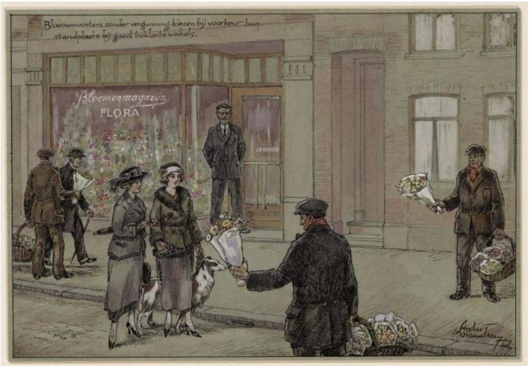
Aquarel André Vlaanderen