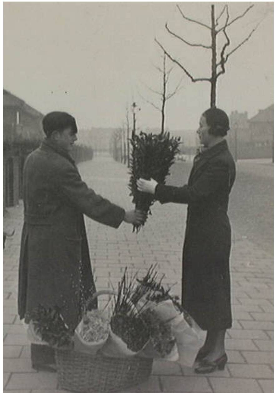
Den Haag, bloemenverkoop op straat

Fotonummer: 1.51456 , Datum: ca. 1935, 1 zwartwitfoto 23 x 15 cm