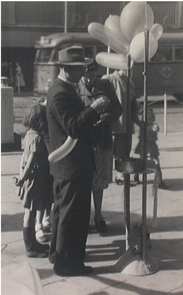
Grote Marktstraat, man met feestballonnen

Fotonummer: 1.51456 , Datum: ca. 1935, 1 zwartwitfoto 23 x 15 cm