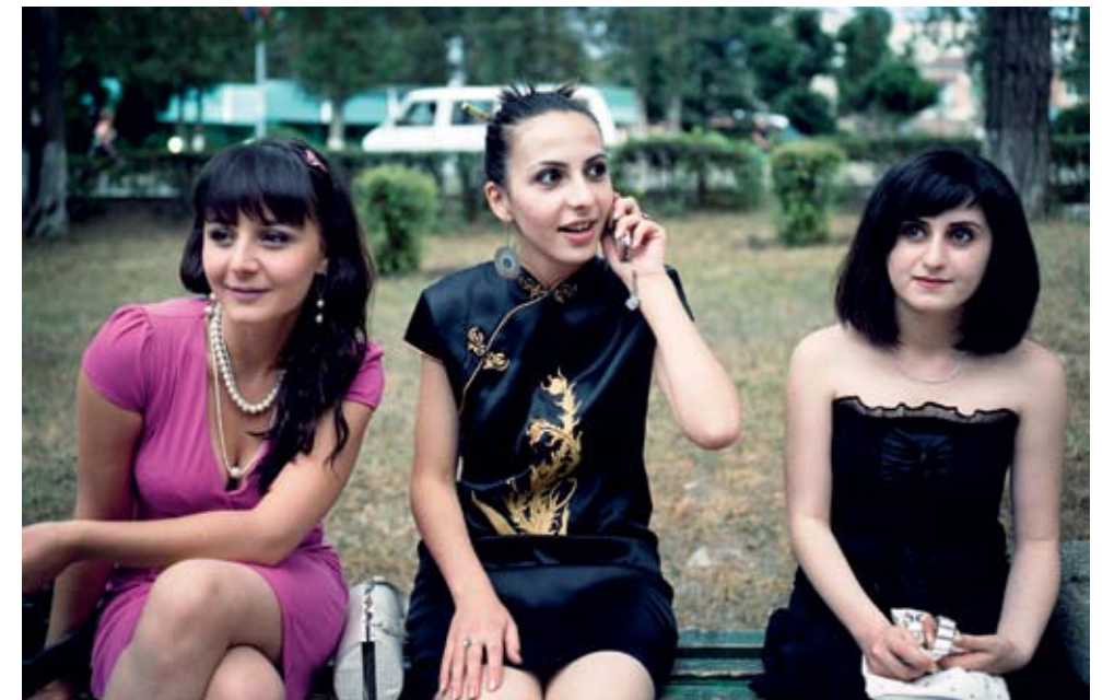
Jonge inwoners van Nagorno-Karabach maken zich iedere dag weer op om te flaneren in het park